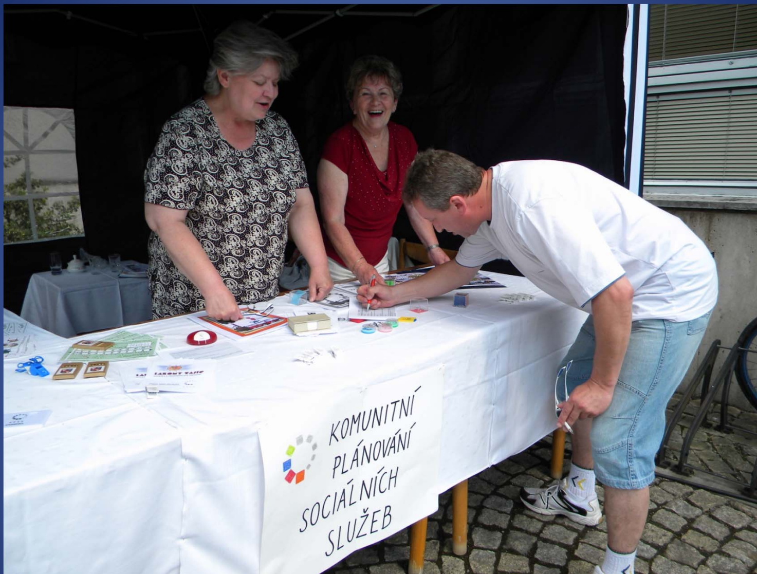
Prezentace komunitního plánování na Dni města.